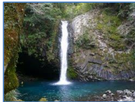
観光スポット 浄蓮の滝