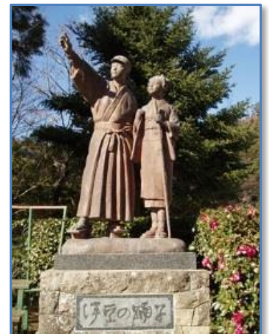
観光スポット 伊豆の踊り子